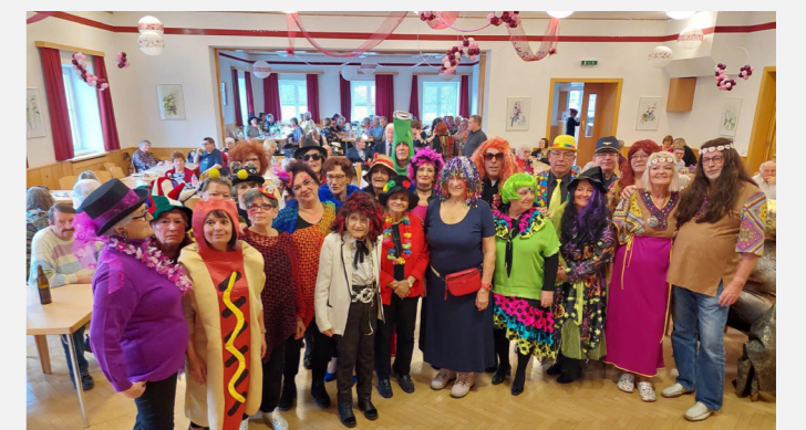
ROSENMONTAG. Bei den Steinbrunner Pensionisten ist immer was los – am Rosenmontag wurde gemeinsam gefeiert, getanzt und gelacht!

- Regelmäßige Zusendung der Zeitschrift „UG – Unsere Generation“