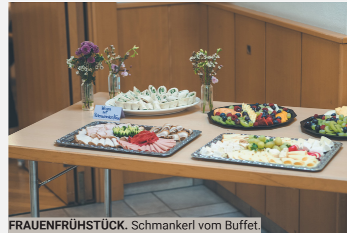
FRAUENFRÜHSTÜCK. Schmankerl vom Buffet.