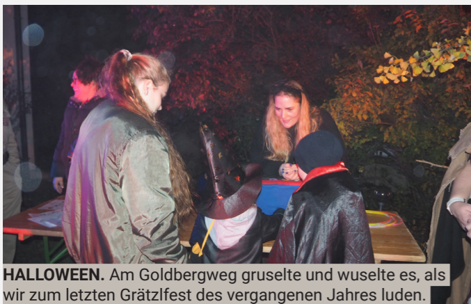
HALLOWEEN. Am Goldbergweg gruselte und wuselte es, als wir zum letzten Grätzlfest des vergangenen Jahres luden.