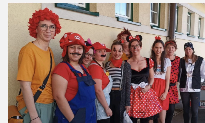
ERFOLGREICHER KINDERFASCHING 2023. Die Kinderfreunde organisierten gemeinsam mit der Frauenbewegung den Kinderfasching.

Am Faschingssonntag fand, zum ersten Mal in Kooperation mit der ÖVP-Frauenbewegung, unser Kinderfaschingsfest statt. Die Kinder hatten viel Spaß bei den Liedern, Spielen in der Fotobox und der Bastelwerkstatt. Das Gemeinschaftshaus platzte aus allen Nähten und auf diesem Weg wollen wir uns bei allen Mithelfenden und Besucher*innen bedanken.