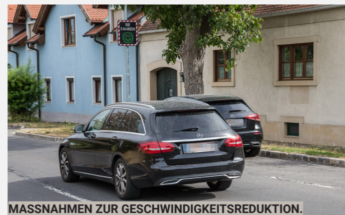
MASSNAHMEN ZUR GESCHWINDIGKEITSREDUKTION.

Gehalten! Entlang der Strittfeldstraße werden Baumtröge aufgestellt, um ein Durchrauschen zu verhindern. Weitere Maßnahmen sind in Planung.