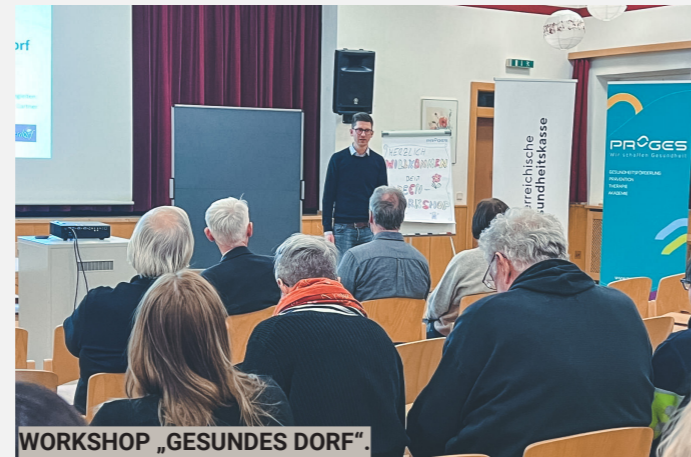
WORKSHOP „GESUNDES DORF“.

Gehalten! Die Aufstockung des Heizkostenzuschusses wurde in der Gemeinderatssitzung vom 21.11.2022 beschlossen.