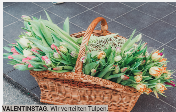
VALENTINSTAG. Wir verteilten Tulpen.