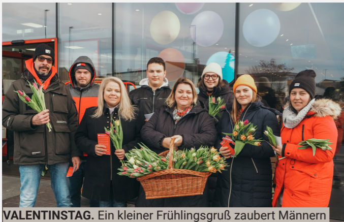
VALENTINSTAG. Ein kleiner Frühlingsgruß zaubert Männern und Frauen ein Lächeln ins Gesicht und tut im Alltagsgrau immer gut.