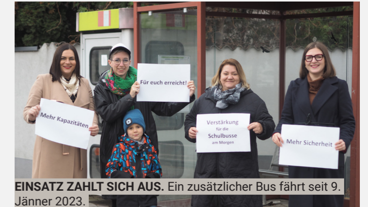
EINSATZ ZAHLT SICH AUS. Ein zusätzlicher Bus fährt seit 9. Jänner 2023.

Dieser Bus fährt nun seit 9.1.2023 und entlastet die besonders betroffenen Haltestellen. Ebenso wurde vom zuständigen Verkehrslandesrat Heinrich Dörner eine weitere Linie zur Entlastung der Situation ab September 2023 versprochen. Eine Erfolgsgeschichte, die zeigt, wie wichtig Zusammenhalt und Ausdauer sind, wenn wir etwas für unser Steinbrunn erreichen wollen!