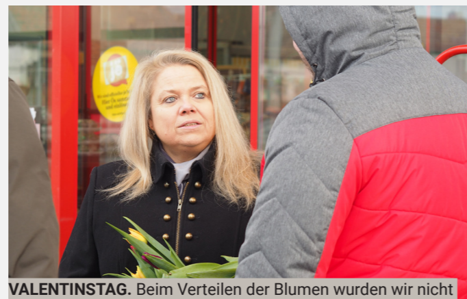
VALENTINSTAG. Beim Verteilen der Blumen wurden wir nicht nur mit einem Lächeln, sondern mit vielen netten Gesprächen belohnt.