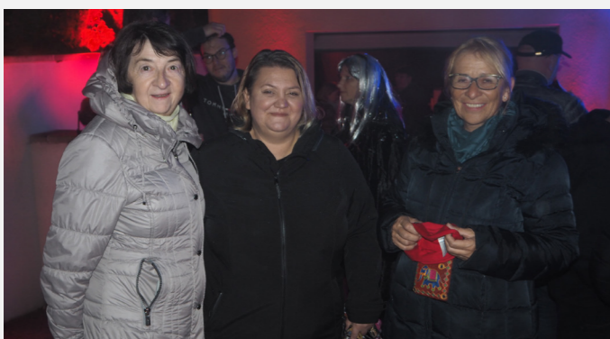
HALLOWEEN. Bei Tee, Glühwein und Punsch gab es Süßes oder Saures, viele Gruselspiele für die Kinder und Junggebliebenen und eine Lichtshow für die Älteren.