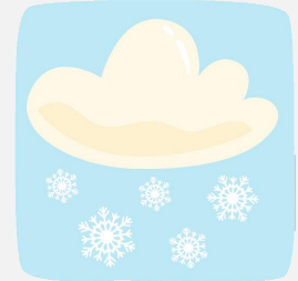
Einen kühlen Kopf bewahren