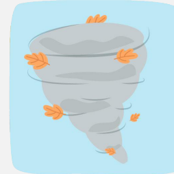
Stürmischen Zeiten begegnen