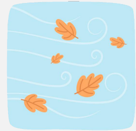
Frischen Wind reinbringen